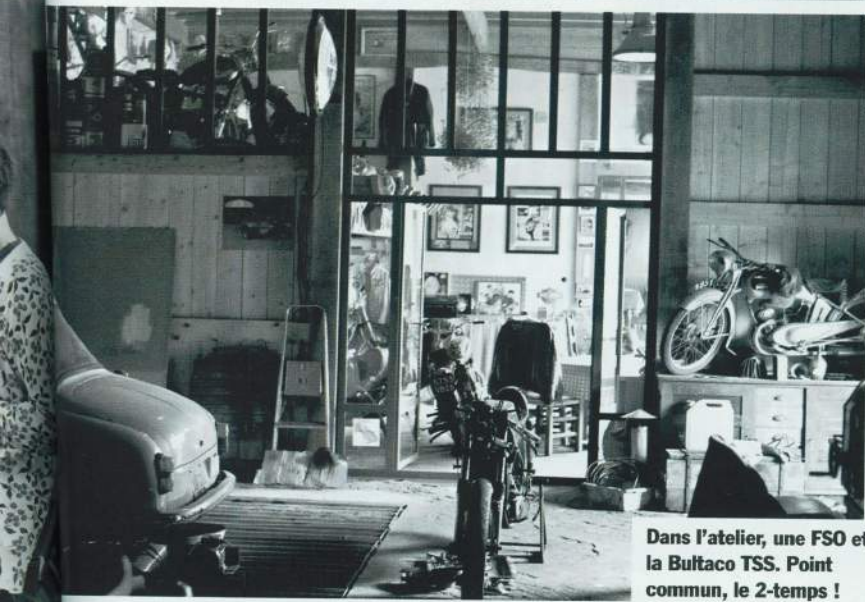
Dans l'atelier, une FSO et la Bultaco TSS. Point commun, le 2-temps !